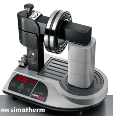
Индукционные нагреватели simatherm

В сельском хозяйстве присутствуют уникальные по своей совокупности проблемы для всех механических компонентов. Такие факторы, как грязь, влажность, вибрация и ударные нагрузки, приводят к выходу подшипников из строя. С помощью продуктов simates можно надежно и эффективно провести ремонтные работы.