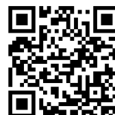
Одноточечный лубрикатер simalube®

ООО «Альтер Би Элемент» Куликовская ул., 12, офис 604 Москва 117628